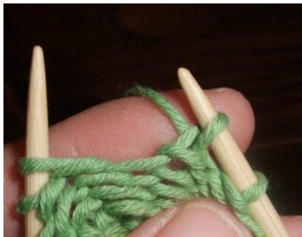
Från avigsidan maskan är lyft.

Varv 2: Lyft den första, ostickade, maskan från vänstra stickan till högra stickan. Sticka nästa maska avigt, garnet ligger runt den första maskan. Fortsätt sticka avigt fram till den sista maskan på varvet. Lägg garnet som om du skulle sticka en rät maska och lyft den sista maskan. Även här blir det ett omslag runt den lyfta maskans bas. Vänd. Fortsätt på detta sätt med de följande varven