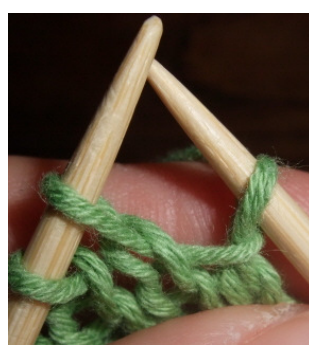
Från rätsidan stickningen är vänd och maskan är lyft.

Varv 3: Lyft den första maskan och sticka rätt till den sista maskan före den ostickade maskan. Lägg om garnet lyft maskan och vänd.