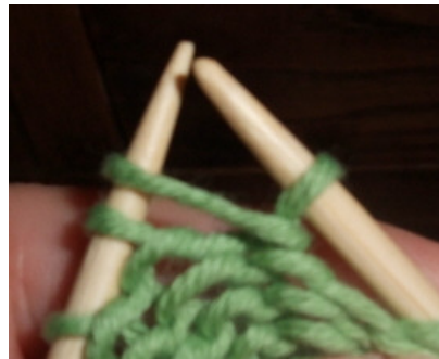
Från avigsidan när man vänt på stickningen.

Varv 2: Lyft den första, ostickade, maskan från vänstra stickan till högra stickan. Sticka nästa maska avigt, garnet ligger runt den första maskan. Fortsätt sticka avigt fram till den sista maskan på varvet. Lägg garnet som om du skulle sticka en rät maska och lyft den sista maskan. Även här blir det ett omslag runt den lyfta maskans bas. Vänd. Fortsätt på detta sätt med de följande varven